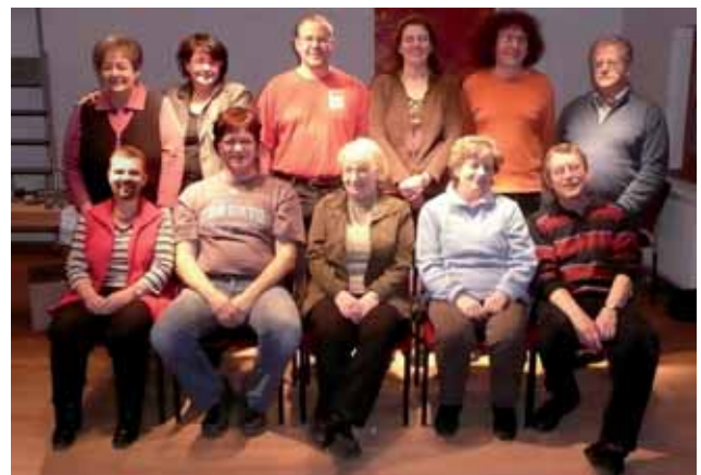
Gruppenfoto der Mitspieler

Nach monatelangen wöchentlichen Proben mit allen beteiligten Hobbyschauspielern ist es nun wieder bald soweit, daß das Lustspiel an den nachfolgenden Terminen gezeigt werden kann.