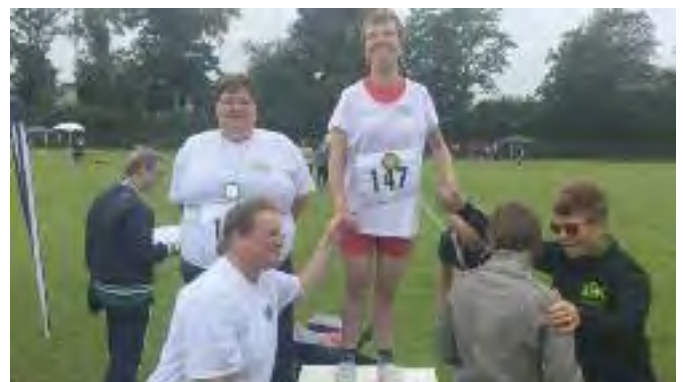
Hier 2 der erfolgreichen Sportler der Behindertengruppe.