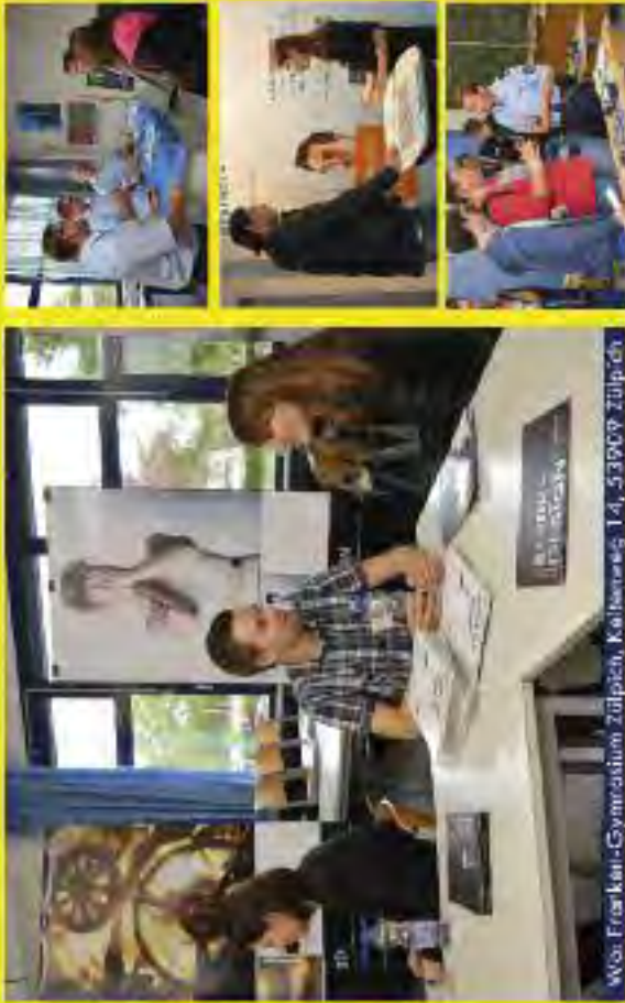
Was: Franklin-Gymnasium Zülpich, Kolonnenweg 14, 53909 Zülpich

Ausbildung, Studium oder auch ein freiwilliges soziales Jahr? Jugendliche müssen sich schon frühzeitig entscheiden, wie es nach der Schule weitergehen soll. Mit inter- nationalen, Vortrag- und praktischen Demonstrationen, herausfordernden Kommunikation, die Zülpicher Ausbildungs- und Studienbörse (nebst einer wertvollen Hilfestellung