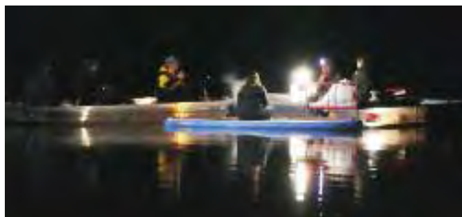
Bei Nacht bot der Zülpicher Wassersportsee eine malerische Kulisse für die Dreharbeiten.

Wann genau die am Zülpicher Wassersportsee gedrehte Folge ausgestrahlt wird, konnten die Produzenten noch nicht sagen. Das Startdatum der neuen Sendereihe, für die unter anderem auch schon eine Skipiste, eine Burgruine, Baumkronen und das Mönchengladbacher Fußballstadion als Kulisse dienten, konnten sie jedoch jetzt schon verraten. Ab 23.09.2017 werden die einzelnen Folgen wöchentlich um 17.20 Uhr auf Kika ausgestrahlt.