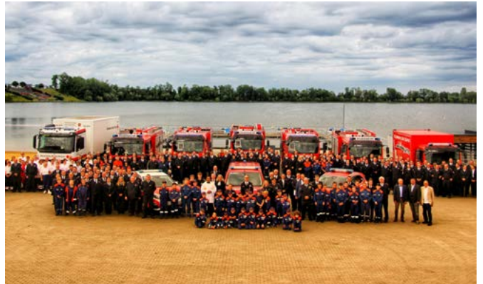
Ein imposantes Bild im Seepark Zülpich: Dort wurden im Rahmen eines Dankesfestes der Stadt Zülpich nicht nur zehn Einsatzfahrzeuge der Zülpicher Feuerwehr und des DRK feierlich eingesehnet, sondern auch mehr als 250 Personen aus dem Stadtgebiet mit der Feuerwehr- und Katastrophenschutz-Einsatzmedaillen des Landes NRW geehrt.

Nicht zuletzt nannte der Bürgermeister natürlich auch den Einsatz während und nach der Hochwasserkatastrophe am 14./15. Juli 2021. Auch wenn es sich bei dieser Veranstaltung nicht in erster Linie um ein Fest zum Dank für den Einsatz während dieser unvergesslichen Tage handelte, nutzte Hürtgen diesen gebührenden Rahmen, um mehr als 250 Feuerwehr- und Katastrophenschutz-Einsatzmedaillen des Landes Nordrhein-Westfalen an jene Helferinnen und Helfer von Feuerwehr und Rettungsdienst zu verleihen, die während der Flutkatastrophe im Einsatz gewesen waren. Die so genannte „Flutmedaille“ war vom Land NRW eigens für diesen Zweck gestiftet und landesweit an rund 62.000 Personen verliehen worden. Bevor es zum gemütlichen Teil überging, oblag es Prädikant Patrick Kisselmann von der evangelischen Christusgemeinde Zülpich und Pfarrvikar Ronald Dhason vom katholischen Seelsorgebereich Zülpich, insgesamt zehn Einsatzfahrzeuge der Zülpicher Feuerwehr und des DRK einzusegnet, die in den vergangenen Jahren angeschafft wurden. Allein für die neun Fahrzeuge der Feuerwehr – ein Gerätewagen Logistik (GW-L), zwei Kommandowagen, fünf Mittlere Löschfahrzeuge (MLF) sowie ein Kleinbus für die Kinderfeuerwehr – hat die Stadt Zülpich seit 2020 städtische Mittel in Höhe von mehr als 1,3 Millionen Euro zur Verfügung gestellt. Auf der Seebühne im Seepark gaben sie mit dem Wassersportsee im Hintergrund ein prächtiges Bild ab.