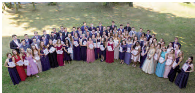
Die Q2 des Jahrgangs 2017/2018 des Franken-Gymnasiums stellte in diesem Jahr 71 Abiturientinnen und Abiturienten.

Besonders erfreulich ist die Tatsache, dass sich unter den Abiturienten des Jahrgangs 2018 wiederum Schülerinnen und Schüler befanden, die von der benachbarten Karl-von-Lutzenberger-Realschule nach dem Erwerb der Fachoberschulreife auf die andere Straßenseite gewechselt waren und am Franken-Gymnasium die Oberstufe erfolgreich abschließen konnten.