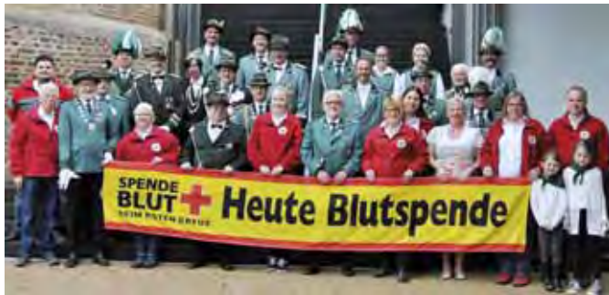
Das Rote Kreuz und die Schützenbruderschaften appellieren gemeinsam an alle Zülpicher Bürger, am Dienstag, 4. Juli, von 15.30 bis 20 Uhr, zur Blutspende ins Forum Zülpich zu kommen.