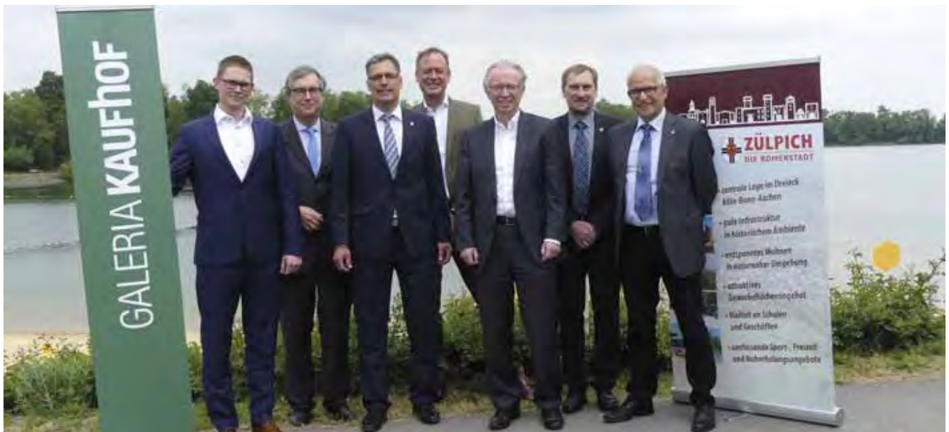
Vertreter von Galeria Kaufhof, NRW.INVEST und Stadt Zülpich beim offiziellen Pressefoto.

Die Galeria-Kaufhof-Gruppe mit Sitz in Köln ist ein europaweit führendes Warenhausunternehmen. Mit seinem innovativen und erfolgreichen Galeria-Konzept präsentiert das Unternehmen moderne Shopping- und Erlebniswelten. Die Galeria-Kaufhof-Gruppe beschäftigt derzeit 21.500 Mitarbeiter und betreibt in Deutschland aktuell 99 Warenhäuser, 58 DINEA Restaurants sowie 16 Warenhäuser in Belgien. Seit dem 1. Oktober 2015 gehört die Galeria-Kaufhof-Gruppe zur Hudson's Bay Company (HBC), einem weltweit aufgestellten Betreiber von Premiumwarenhäusern. Weitere Informationen unter: www.kaufhof.de Kontakt: Stadt Zülpich, Abteilung für Wirtschaftsförderung Tel.: +49 (0)2252/52 248, E-Mail: ovoigt@stadt-zuelpich.de Galeria Kaufhof GmbH, Unternehmenskommunikation Tel.: + 49 (0)221/223-5595, E-Mail: presse@kaufhof.de