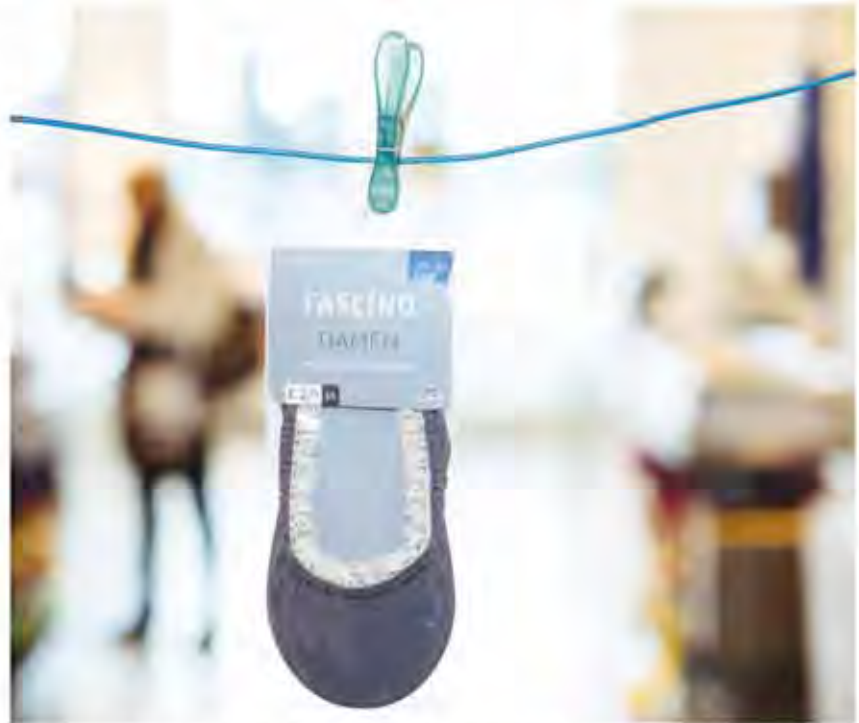
Fast zu schön, um im Sneaker zu verschwinden: die sommerlichen Socken von Fascino

Das dm-Team in Zülpich hat im Kasenbereich Platz gemacht für die große Auswahl saisonaler Produkt-Highlights der dm-Marke Fascino. „Ob spezielle Socken für Sneaker und Ballerina oder Kniestrümpfe mit kühlender Sohle – die Neuheiten für den Sommer kommen richtig gut an“, weiß dm-Filialleiterin Gabriele Frechem.