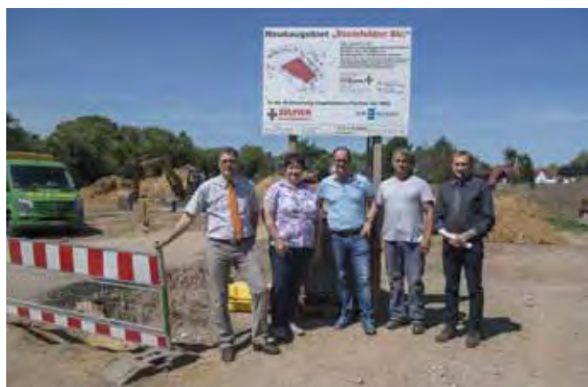
Geschäftsführung der SEZ beim Baustellentermin mit der Baufirma.

Aufgrund der erfreulich positiven Nachfrage –mehr als 40 Interessenten hatten sich in eine Bewerberliste eintragen lassen- erfolgte die Grundstücksvergabe im Wege eines notariell begleiteten Losverfahrens.