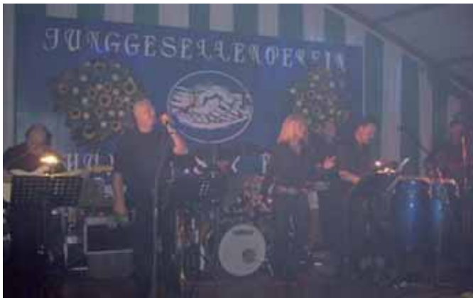
Show- und Tanzband „New Barbados“ beim Kirmesball

Am Kirmesfreitag feierten „Jung und Junggebliebene“ gemeinsam im rappelvollen Festzelt zu den Beats der 80er und 90er Jahre sowie den Hits von heute, aufgelegt von DJ Fuchs. Der Kirmesamstag stand ganz im Zeichen des Hahnenkönigpaars: Nach dem Umzug durch den Ort und einem sehr schönen Feuerwerk fand im Festzelt ein rundum gelungener Kirmesball statt. Die auch über die Grenzen des Kreises Euskirchen hinaus bekannte Show- und Tanzband „New Barbados“ konnte dabei einmal mehr ihre Klasse beweisen und für ausgelassene Stimmung und viel Spaß auf der Tanzfläche sorgen.