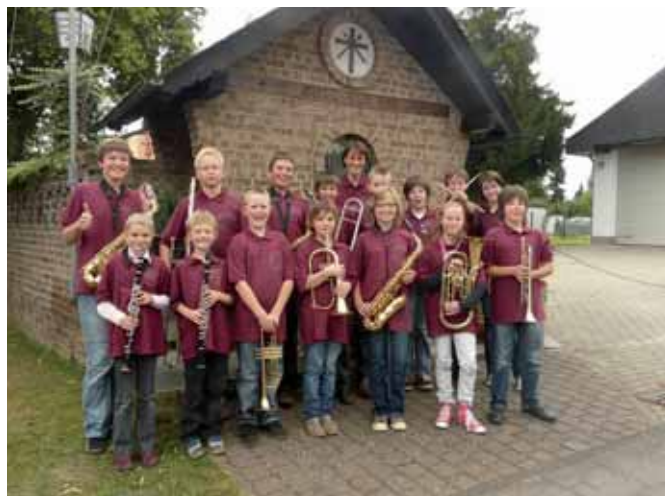
Im Anschluss an das gelungene Premierenkonzert formierten sich die Teilnehmer für ein erstes Gruppenfoto.

Am Kirmessonntag-Nachmittag konnte sich das Jugendorchester erstmals in einheitlicher Kluft präsentieren. Die mit „Jugendorchester Musikverein Sinzenich“ beschrifteten Polo-Shirts waren von einem ungenannten Förderer gestiftet worden und kamen bei den Jugendlichen und dem Publikum recht gut an. Im prall gefüllten Festzelt konnten die jungen Musiker und Musikerinnen in einem über einstündigen Konzert ihr in einem Jahr einstudiertes Programm gekonnt präsentieren. Nicht nur die musikalische Leiterin, Andrea Cosman, sondern, wie sich am Applaus abschätzen ließ, auch das Publikum, zeigten sich mit der in diesem relativ kurzen Zeitraum erarbeiteten musikalischen Leistung sehr zufrieden.