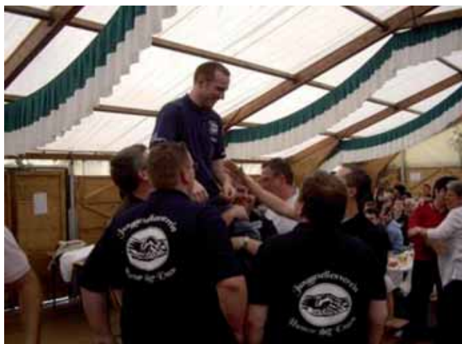
Bull – Riding Contest am Sonntag

Nach dem gemeinsamen Gottesdienst am Sonntagmorgen und der Kranzniederlegung am Ehrenmal folgte ein Frühschoppen der besonderen Art. Kurzfristig verpflichtet, wurden die Gäste dabei mit den „Original-Nordeifel-Musikanten“ überrascht. Diese sorgten prompt für Oktoberfeststimmung und konnten auch den ein oder anderen Gast zum mitmachen animieren. Am Nachmittag sorgte der Bull-Riding-Contest Vol. 2 erneut für ausgelassene Stimmung und bot jedem die Chance, eine der drei heiß begehrten Trophäen abzustauben.