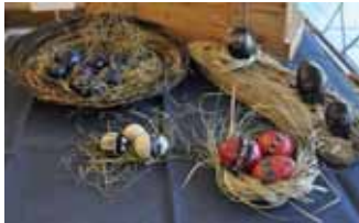
Die dekorative Ostereier aus Speckstein verschönern den Ostertisch Fotos und Text: Petra Grebe

Ständige Ausstellungen auf 400 m 2 . Fragen SIE nach unseren günstigen Angeboten!!!