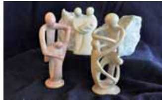
Die formschönen Skulpturen sind im ganzen Jahr eine schöne Geschenkidee.

Heute sind etwa 200 Familien Mitglied der Selbsthilfegruppe und alle verfügen über langjährige Erfahrung in der Verarbeitung des Specksteins. Die Gruppe verarbeitet den Kisii-Speckstein, ein Naturstein, der nur im Hochland von Kisii (etwa 400 Kilometer südwestlich von Nairobi/Kenia) vorkommt. Es handelt sich um eine Specksteinart, die verschiedene Farbschattierungen und Härten aufweist. Er enthält keine gefährlichen Substanzen und ist damit unschädlich für Mensch und Tier. Der Abbau erfolgt über Tage und ist harte körperliche Arbeit. Die obere Erdschicht wird bis zu einem Meter abgetragen, um an den Stein heranzukommen. Große Felsbrocken werden dann mit Handsägen in kleine, tragbare Stücke zerteilt, die dann auf dem Kopf, auf Ochsenkarren oder kleinen Transportern zu den Häusern und Werkstätten der Kunsthandwerker gebracht werden. Für die spätere Bearbeitung werden einfache traditionelle Werkzeuge verwendet. Während der Produktion werden die einzelnen Gegenstände einer Qualitätskontrolle unterzogen, um die Einhaltung der erforderlichen Standards zu überprüfen. Gefertigt werden verschiedenste Produkte, wie Tiere, dekorative Teller, Schachspiele oder auch abstrakte Skulpturen. Im FairCafe ist ein breites Sortiment zu finden, wobei auch Specksteinartikel aus anderen Regionen angeboten werden. Passend zur Jahreszeit sind zur Zeit auch dekorative Ostereier in verschiedenen Ausführungen erhältlich.