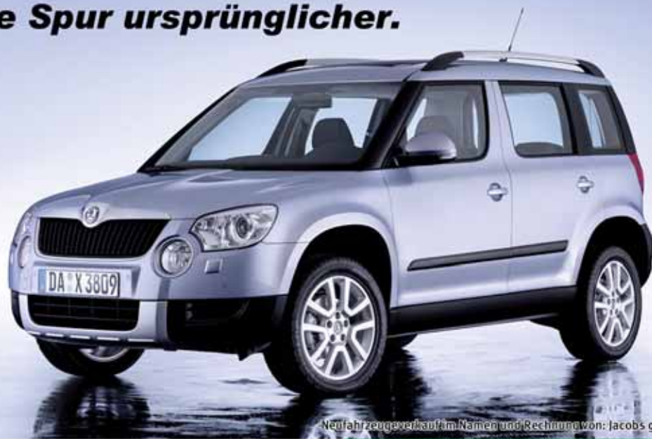
Neufahrzeugverkauf im Namen und Rechnung von: Jacobs group

Der Skoda Yeti. Eine Spur ursprünglicher.