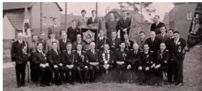
Gruppenfoto von 1968

Die Bruderschaft richtete 1968 das Kreisbundes-Schützenfest des Kreisschützenbundes Düren aus. Dieses Fest wurde am Namenstag des Hl. Donatus gefeiert. Seither wurde dieser Termin beibehalten und das Schützenfest am 5. Sonntag nach Ostern gefeiert. Zu diesem Kreisschützenfest kamen weit über 1000 Schützen aus 35 Bruderschaften. Zu dieser Zeit säumten noch hunderte von Menschen die Straßen und klatschten den vorbei marschierenden Schützen Beifall.