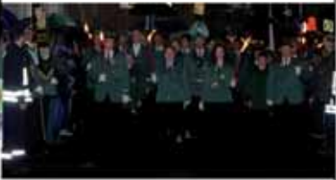
Die Ehrenformation marschiert auf den Marktplatz zur Aufstellung