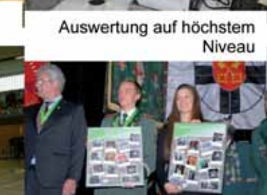
Foto-Collage für die alten Majestäten