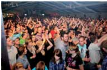
TOOLTIME – Party im Festzelt