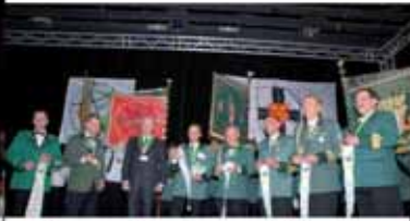
Ehrung für die ausrichtenden Schützenbruderschaften beim Stadtempfang - einige waren im Helfereinsatz verhindert