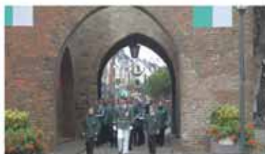
Die Spitze des Festzuges im Kölntor