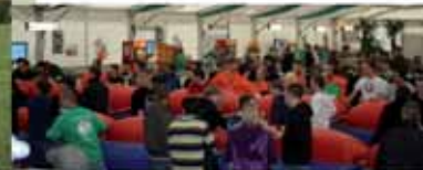
Lebendkickerturnier am Samstagmorgen im Festzelt - Super Stimmung bei Mistwetter