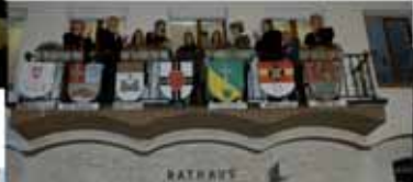
Siegerehrung auf dem Rathausbalkon