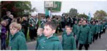
Vorbeimarsch an der Ehrentribüne