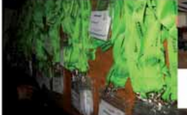
2028 Teilnehmerausweise – 550 Helfer – 130 Ordner