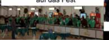
Die Thekencrew - Einweisung der Helfer aus Gemünd