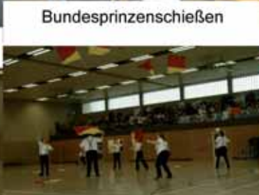
viele Zuschauer - großes Interesse der Zülpicher