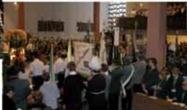
78 Fahnen und Standarten in der Messe, es gab keinen Stehplatz mehr