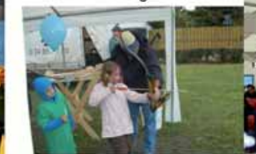
Bogenschießen – Training inklusive