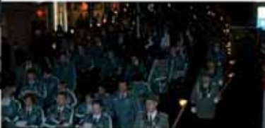
Festzug vom Marktplatz zum Adenauerplatz