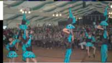
Schwerfener Garde beim Rahmenprogramm am Samstagnachmittag