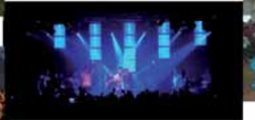
TOOLTIME – LIGHTSHOW am Samstagabend