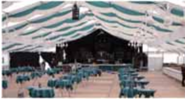
Das Festzelt - Ruhe vor dem Sturm