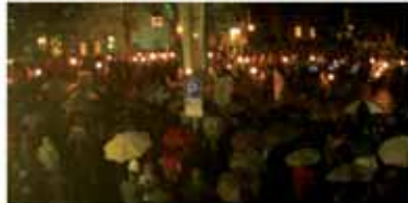
Großer Zapfenstreich - Marktplatz voller Zuschauer