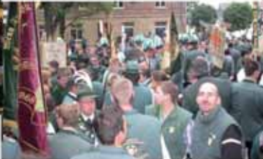
Zugaufstellung vor St. Peter