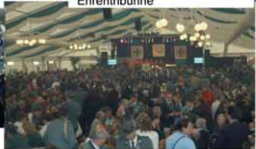
Ausklang der BJT nach dem Festzug am Sonntagnachmittag

Der Verein BJT 2010 bedankt sich bei allen Helfern, Spendern und Sponsoren für die Unterstützung bei der Durchführung der Bundesjungschützen tage.