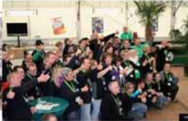
Das BJT TEAM - Einschwören auf das Fest