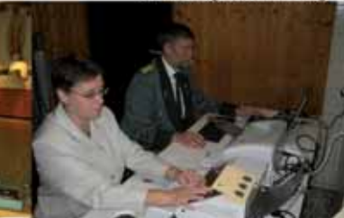
Auswertung auf höchstem Niveau