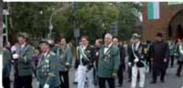
Bundesvorstand im Festzug