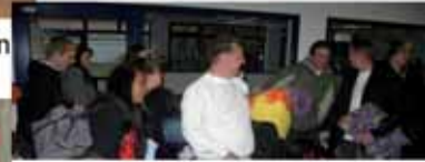
Die ersten Teilnehmer